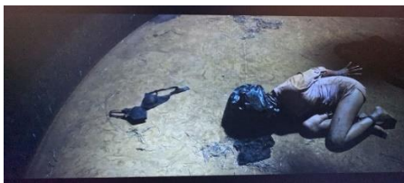
Gambar 4. Penculikan, Kekerasan Seksual, dan Pembunuhan kepada Bertha

Pada tingkat mitos , adegan ini mengkritik budaya patriarki yang sering kali menormalisasi atau membungkam kekerasan seksual terhadap perempuan. Film memperlihatkan bahwa kekerasan tersebut bukan hanya persoalan individu, tetapi berkaitan dengan struktur sosial yang menempatkan perempuan dalam posisi subordinat dan rentan terhadap eksploitasi.