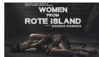
Gambar 1. Poster Film Women from Rote Island

Film Women from Rote Island adalah film drama Indonesia karya Jeremias Nyangoen yang dirilis pada tahun 2023. Film ini menggunakan bahasa Rote dan berlatar kehidupan masyarakat Pulau Rote, Nusa Tenggara Timur, dengan mengangkat isu kekerasan terhadap Perempuan, budaya patriarki dan perlawanan Perempuan.