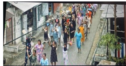
Gambar 6. Aksi Perempuan Menuntut Keadilan di Depan Polsek Rote Ndao

otoritas adat yang selama ini mendominasi pengambilan keputusan dalam masyarakat. Sikap Orpa menunjukkan keberanian untuk mempertahankan hak dan suara perempuan, sekalipun harus berhadapan dengan tekanan sosial dan budaya. Pada tingkat mitos , adegan ini membongkar anggapan bahwa perempuan harus selalu tunduk pada aturan adat. Film menghadirkan narasi bahwa perempuan memiliki agensi dan kemampuan untuk mengambil keputusan sendiri, bahkan dalam situasi yang sarat dengan nilai-nilai tradisional.