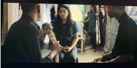
Gambar 5. Orpa Menolak untuk Menguburkan Jenazah Suaminya.

perempuan terhadap ketidakadilan. Perlawanan tersebut ditunjukkan melalui sejumlah adegan yang menggambarkan upaya perempuan dalam mempertahankan martabat dan memperjuangkan keadilan.