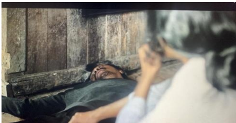
Gambar 7. Perlawanan Orpa terhadap Pelaku Pembunuhan Bertha

Ndao, menyuarakan tuntutan dan melakukan demonstrasi untuk memperoleh keadilan. Secara konotatif , adegan ini merepresentasikan solidaritas dan kesadaran kolektif perempuan dalam melawan ketidakadilan. Perlawanan tidak lagi bersifat individual, tetapi berkembang menjadi gerakan sosial yang melibatkan komunitas untuk menuntut perubahan. Pada tingkat mitos , adegan ini membangun narasi bahwa perempuan memiliki kekuatan ketika bersatu dalam ruang publik. Film menantang anggapan bahwa perempuan terbatas pada ruang domestik, dengan menunjukkan bahwa perempuan mampu menjadi agen perubahan sosial melalui aksi kolektif.