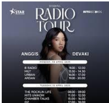
Gambar 7 Jadwal radio tour Anggis

Kegiatan tersebut meliputi showcase, intimate concert, meet and greet, radio tour, dan media visit .