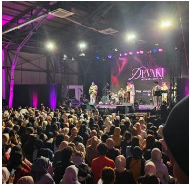
Gambar 6 Intimate concert dan meet & greet album DEVAKI

Kegiatan tersebut meliputi showcase, intimate concert, meet and greet, radio tour, dan media visit .